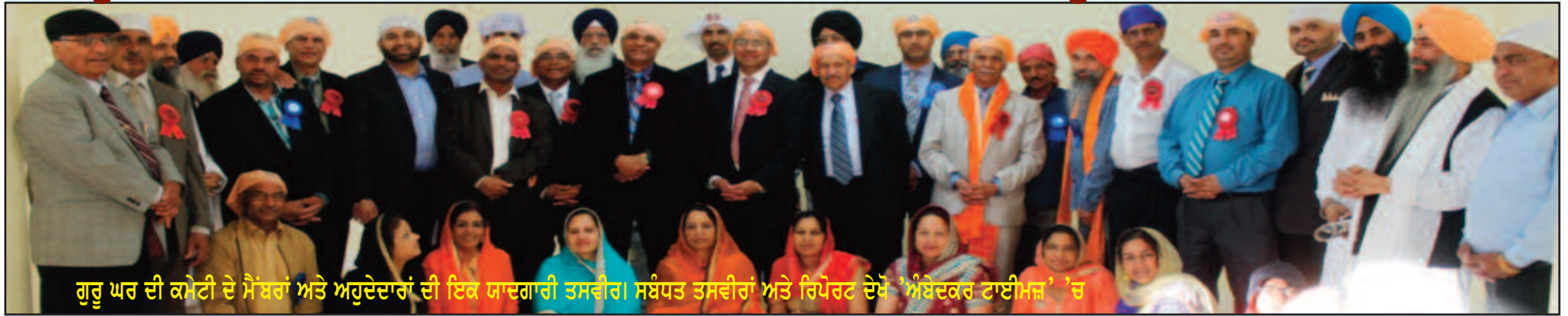
ਗੁਰੂ ਘਰ ਦੀ ਕਮੇਟੀ ਦੇ ਮੈਂਬਰਾਂ ਅਤੇ ਅਹੁਦੇਦਾਰਾਂ ਦੀ ਇਕ ਯਾਦਗਾਰੀ ਤਸਵੀਰ। ਸਬੰਧਤ ਤਸਵੀਰਾਂ ਅਤੇ ਰਿਪੋਰਟ ਦੇਖੋ 'ਅੰਬੇਦਕਰ ਟਾਈਮਜ਼' 'ਚ