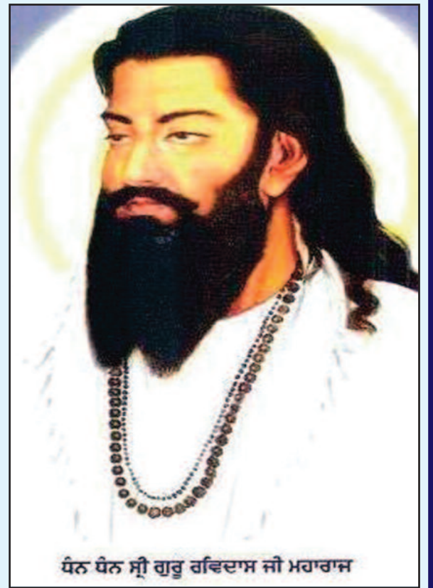
ਧਨ ਧਨ ਸ੍ਰੀ ਗੁਰੂ ਰਵਿਦਾਸ ਜੀ ਮਹਾਰਾਜ