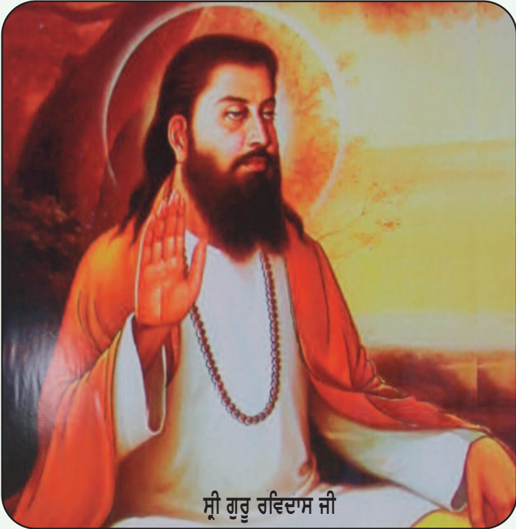
ਸ੍ਰੀ ਗੁਰੂ ਰਵਿਦਾਸ ਜੀ