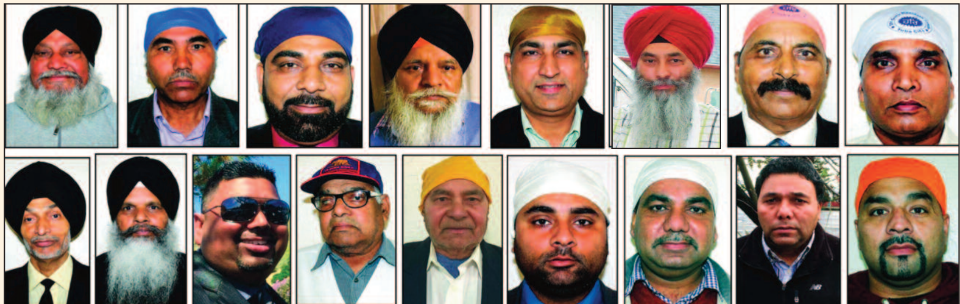
ਸ੍ਰੀ ਗੁਰੂ ਰਵਿਦਾਸ ਟੈਂਪਲ ਯੂਬਾ ਸਿਟੀ (ਕੈਲੋਫੋਰਨੀਆ) ਦੇ ਅਹੁਦੇਦਾਰ ਅਤੇ ਮੈਂਬਰ

ਗੁਰੂ ਕੇ ਲੰਗਰ ਤਿੰਨੇ ਦਿਨ ਅਤੁੱਟ ਵਰਤਾਏ ਜਾਣਗੇ। ਇਹਨਾਂ ਸਮਾਗਮਾਂ ਵਿਚ ਜੇ ਕਿਸੇ ਵੀ ਗੁਰਮੁਖ ਪਰਿਵਾਰ ਨੇ ਸੇਵਾ ਲੈਣੀ ਹੋਵੇ ਤਾਂ ਉਹ ਹੇਠ ਲਿਖੇ ਨੰਬਰਾਂ ਤੇ ਸੰਪਰਕ ਕਰ ਸਕਦਾ ਹੈ ਜੀ: