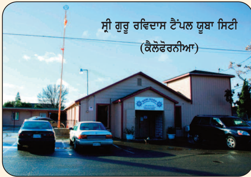
ਸ੍ਰੀ ਗੁਰੂ ਰਵਿਦਾਸ ਟੈਂਪਲ ਯੂਬਾ ਸਿਟੀ (ਕੈਲੋਫੋਰਨੀਆ)